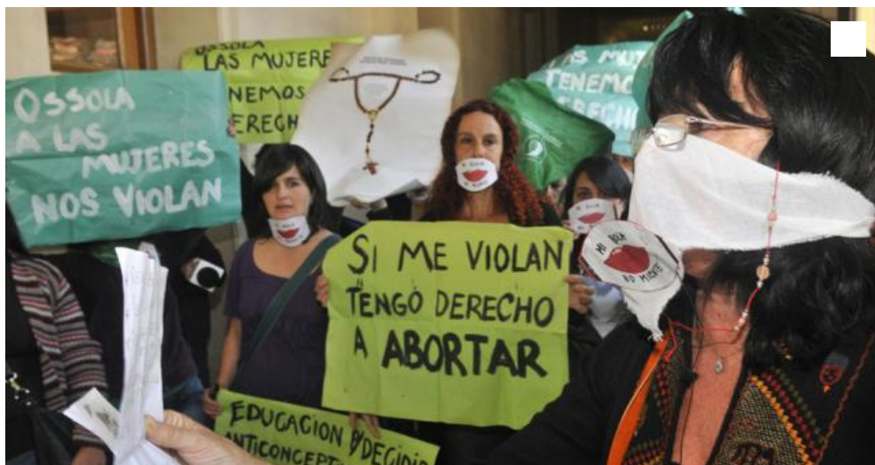
Presión. En Tribunales I, los grupos a favor del aborto protestan contra el juez Ossola.

Es porque sigue vigente la medida cautelar que impide aplicar la guía del Ministerio de Salud en hospitales provinciales.